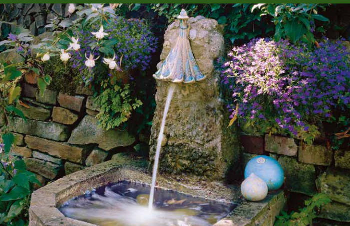
▲ Garten Tegtmeyer, Bad Salzuflen