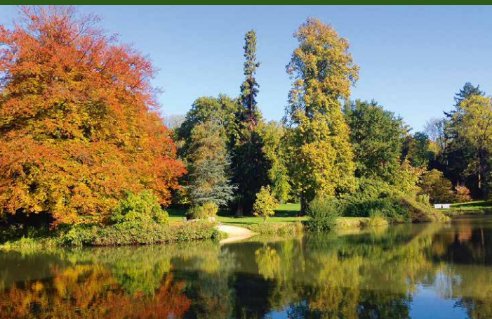
▲ Garten von Dallwitz, Leopoldshöhe