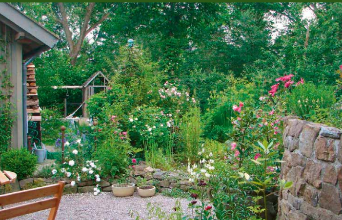
▲ Garten Schmidt, Lage