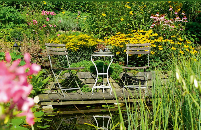
▲ Garten Spilker, Detmold