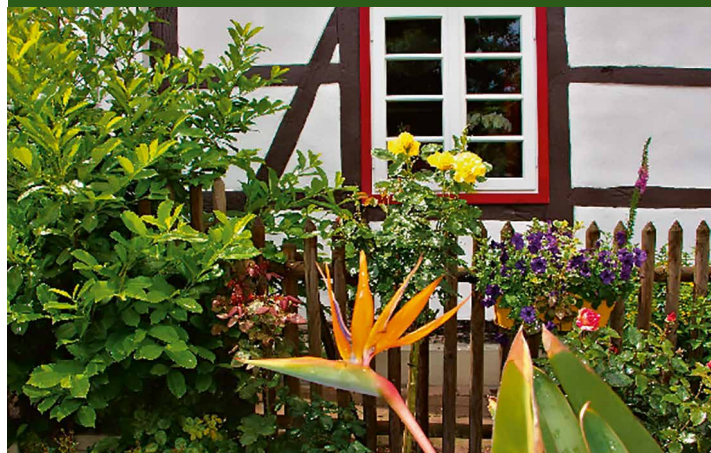
▲ Garten Spicher/Vieth, Blomberg

Naturbelassener Garten (ca. 1.000 qm) mit Staudenbeeten, englischen Rosen, Buchsbaum, Kräuterspirale, Gewächshaus, Gemüsehochbeet und Gartenteich.