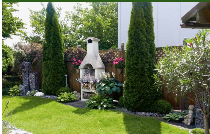
▲ Garten Wagner, Leopoldshöhe