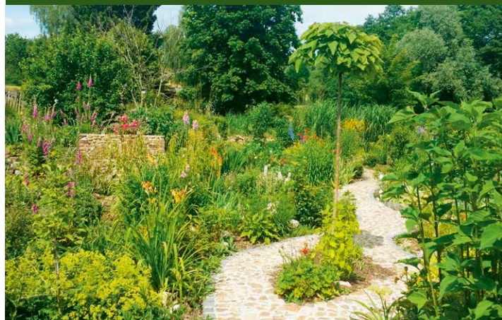
▲ Garten Schich, Detmold

Sonderaktion: Verkauf von eigenen Rosenablegern zugunsten der Flüchtlingshilfe.