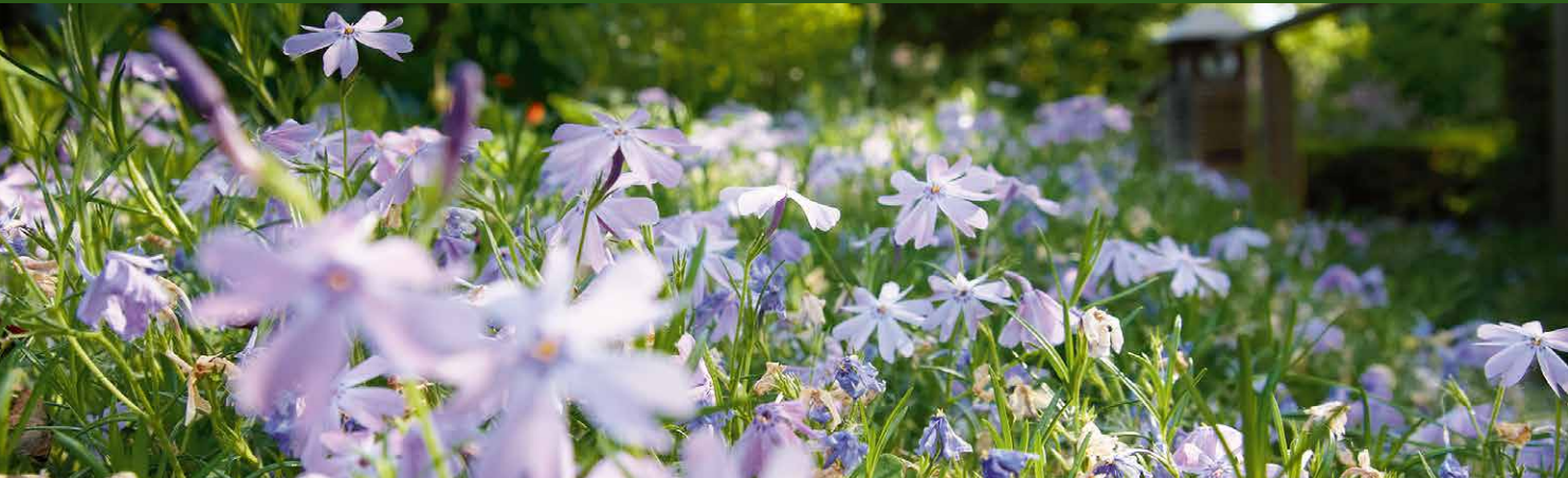
▲ Garten Tegtmeyer, Bad Salzuflen