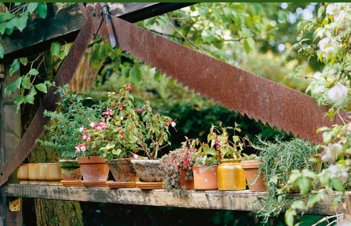
▲ Garten Tegtmeyer, Bad Salzufen

Wie viele Gartenideen kommt auch die Bewegung der offenen Gartenporten aus Großbritannien zu uns. Dort ist schon 1927 „The National Gardens Scheme“ entstanden und zu einer Art Volksbewegung geworden. Die Events in den privaten Gärten haben eine besondere Atmosphäre: Die Stimmung ist bestens, die Frauen tragen Hüte, bei Tee und Keksen zwischen Rosen und Kohl gibt es viel Gartensachverstand, eingebettet in Smalltalk.