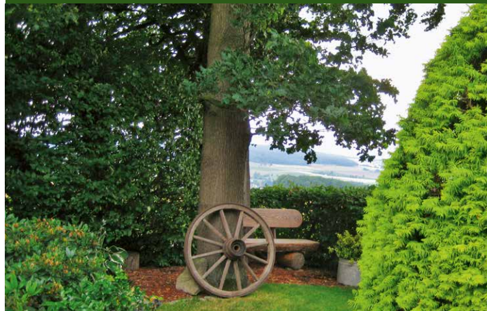
▲ Garten Jost, Dörentrup