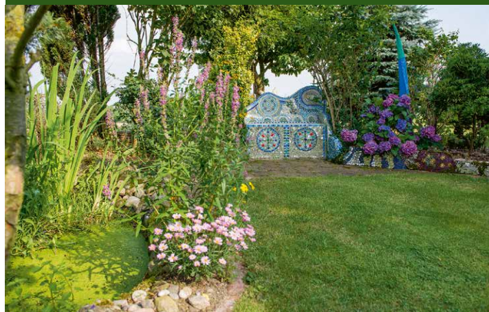
▲ Garten Stute, Lemgo

Kleiner Garten (ca. 600 qm) mit Teichanlage, Insektenhotel, Hochbeeten, Obstbäumen und selbstgemachten Zäunen.