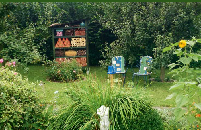
▲ Garten Reiche, Lemgo