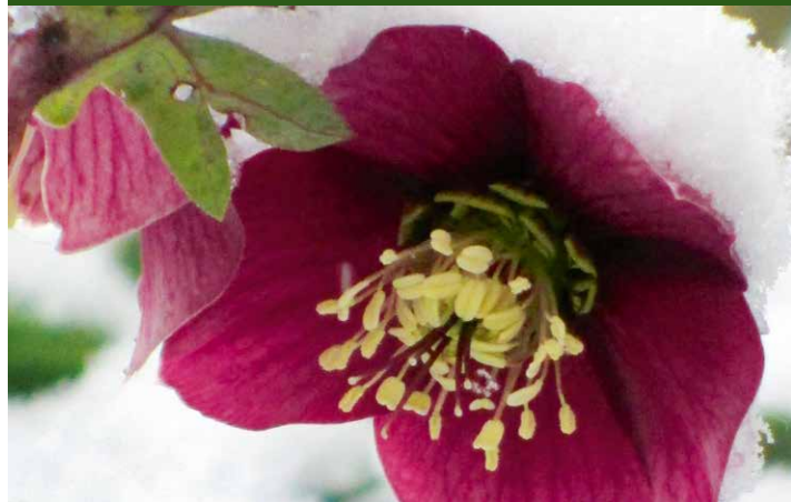
▲ Garten Centmayer-Swoboda, Schieder-Schwalenberg

Der 1.500 qm große Garten mit Teich liegt direkt am Waldrand und wird von zwei Bächen eingerahmt. Auf schmalen Wegen kann der Garten bis in den beschaulichsten Winkel erkundet werden. Ein bunter Mix aus Stauden und verschiedensten Gehölzen erwartet Sie.