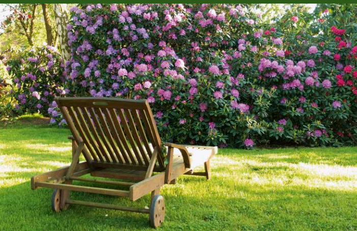
▲ Garten Kelm, Detmold