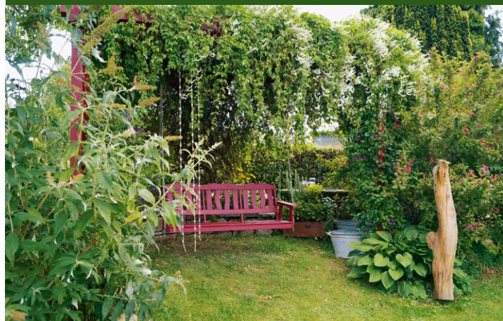
▲ Garten Kasper, Barntrup