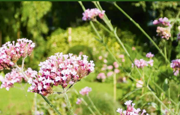
▲ Garten Kriete, Schlangen