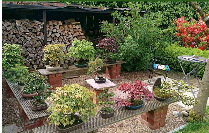
▲ Garten Merz, Lemgo

In unserem kleinen Garten (ca. 500 qm) können Besucher in verschiedenen Lauben, Teehäuschen, Pavillons und auf Sitzplätzen an einem 6x8 m großen Teich verweilen.