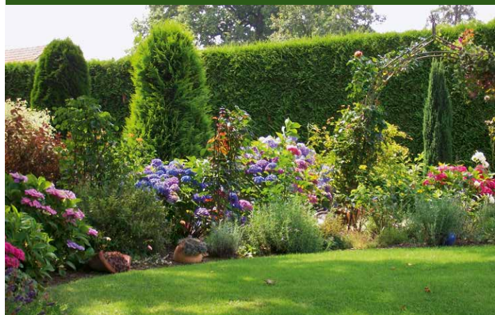
▲ Garten Koch, Kalletal