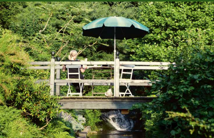
▲ Garten Buhr, Lügde