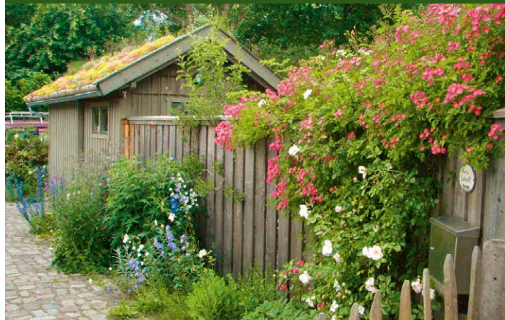
▲ Garten Schmidt, Lage