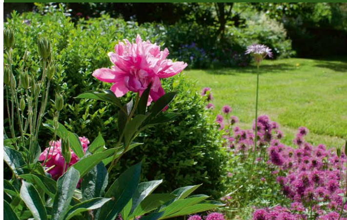
▲ Garten Asemissen, Leopoldshöhe

Sie besuchen private Gärten und betreten die Anlagen auf eigene Gefahr.