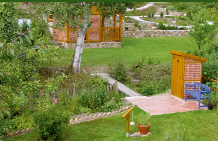
▲ Garten Hoffmann, Extertal