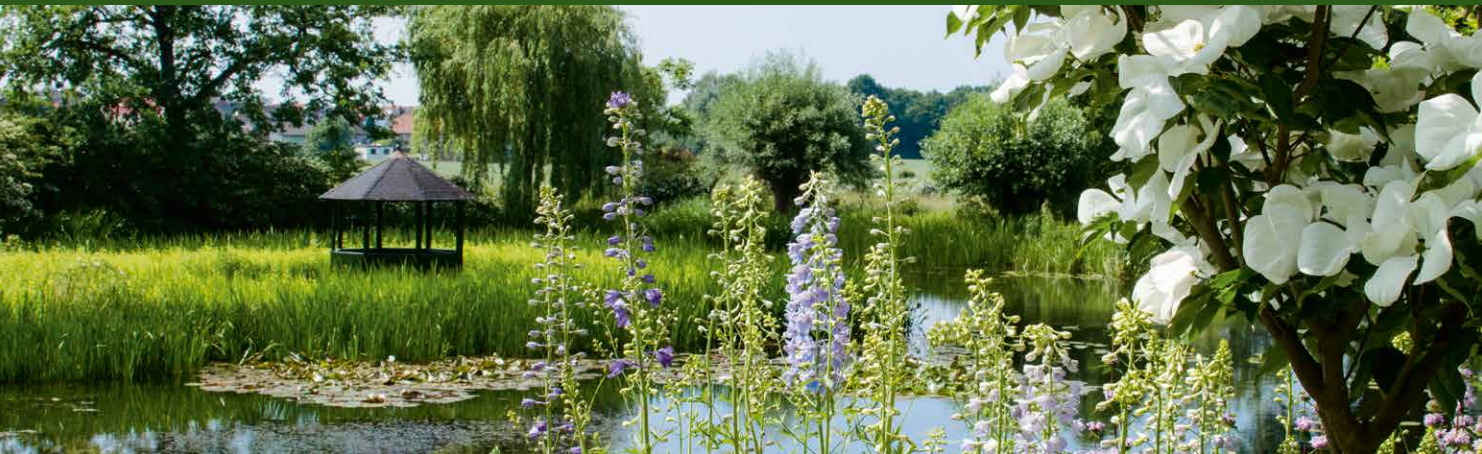
▲ Garten Asemissen, Leopoldshöhe