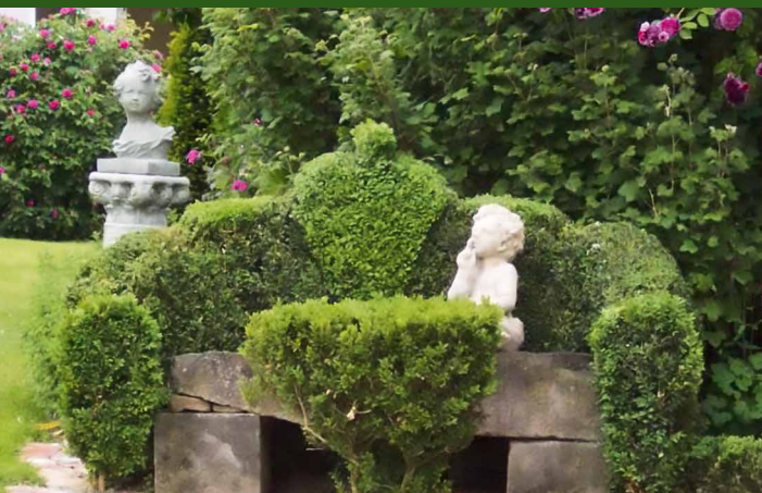
▲ Garten Oerder, Blomberg